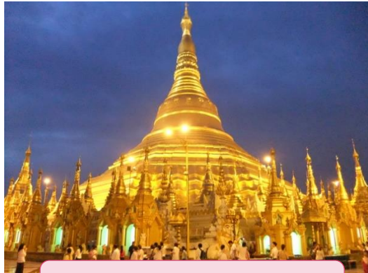
シュエダゴンパゴダ